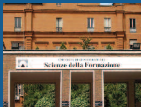
Scienze della formazione