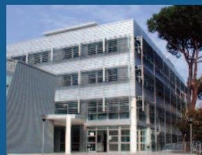
Lingue letterature e culture straniere