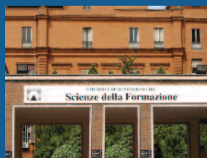
Scienze della formazione