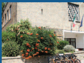
Matematica e fisica