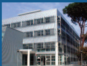
Lingue letterature e culture straniere