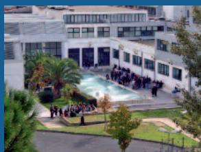
Filosofia, comunicazione e spettacolo