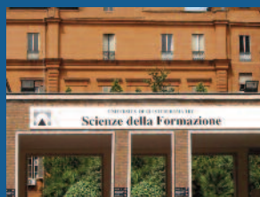
Scienze della formazione