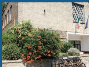
Matematica e Fisica