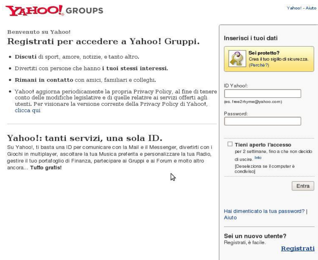
Figura 3 - Pagina di registrazione di Yahoo!