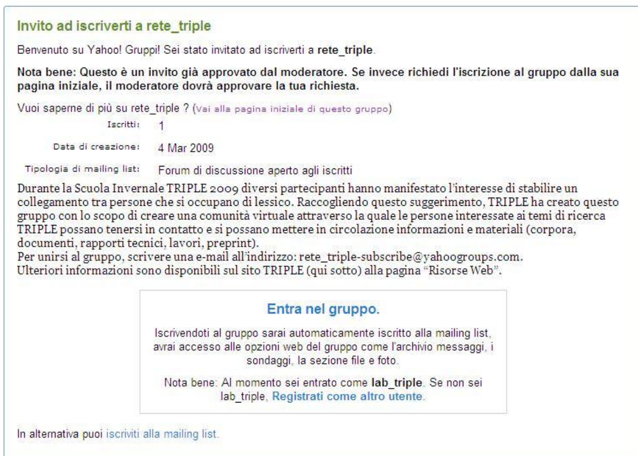
Figura 2 - Invito ad iscriversi al gruppo rete_triple