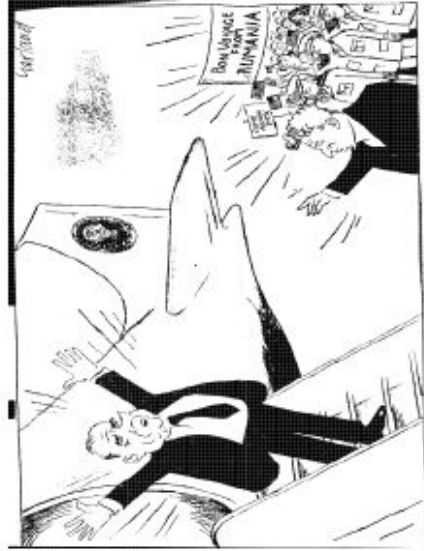
Nicholas Garland, Daily Telegraph, 4 Agosto 1969