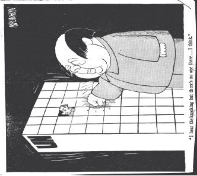
Edward McLachlan, Evening Standard, 23 Novembre 1970