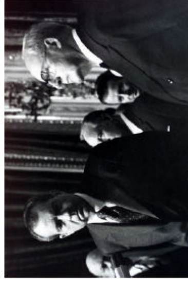
Nixon e Saragat

17,00-18,30 DISCUSSIONE E CONCLUSIONI CELOZZI BALDELLI