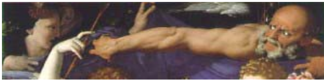
A. BRONZINO, Il vizio che disvela la virtù, particolare London—National Gallery