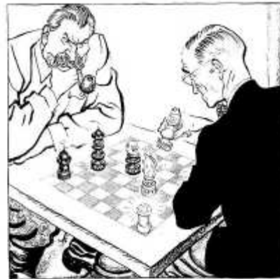
"Superpowers play chess" Illingworth, [Leslie Gilbert], 14 Febbraio, 1949