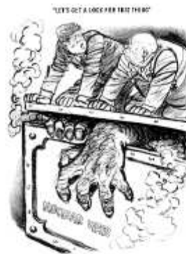
Herblock, [Herbert L. Block], The Washington Post , 1 Novembre, 1962