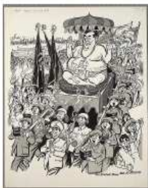
"The New Religion", Edmund Vaultman The Hartford Times , 13 Ottobre, 1966