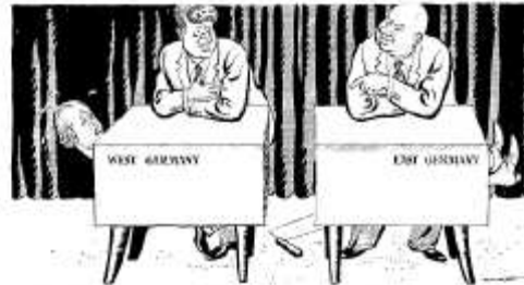
Illingworth, [Leslie Gilbert], Sunday Dispatch , Novembre 1961