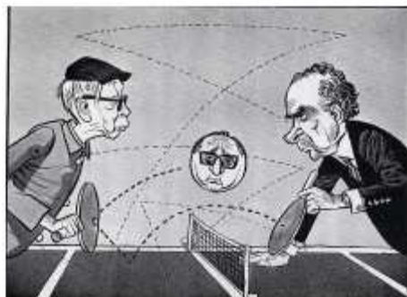
"Viet Nam Ping Pong", Duncan Macpherson, Toronto Star 1973