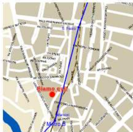
Metro Linea B Fermata Marconi, Via Ostiense 236

Con il contributo del Dipartimento di Studi Storici Geografici Antropologici Università Roma Tre