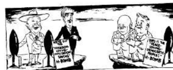
Vicky [Victor Weisz], Daily Mirror , 27 Aprile 1956