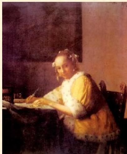
Jan Vermeer, Donna che scrive , 1665

Non siate solo stendardi ma siate anche terra presente non siate solo musica ma anche silenzio di perla. non perdetevi mai il contatto del vostro cammino: ricordatevi che il sangue si ferma perché non vuole parlare