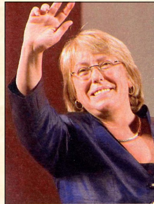
Michelle Bachelet (54 anni) Neopresidente del Cile, arrestata e torturata, insieme con la madre e il padre, durante la dittatura del gen. Pinochet.

La campagna elettorale del suo avversario era rivolta a quella componente di centro, cristiana, che mal sopportava una candidata agnostica e divorziata. Ma proprio questo